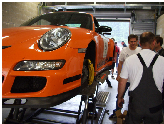
Stand du Club à SPA aux Porsche Days