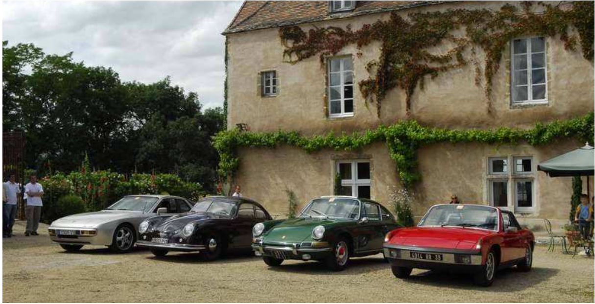
Podium du Classic Meeting